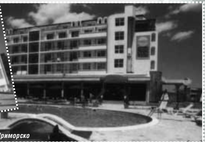
Х-л „Перла“ – Приморско

Това е едно от хотелчетата, които предлагат максимално количество услуги за своите гости, включително и за хора с инвалидни колички. Качеството е наистина на европейско ниво. На собствениците и през ум не им минава да определят бизнеса си като милосърдно дело в подкрепа на инвалидите.